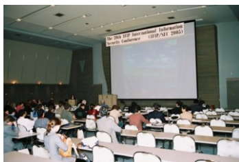
(幕張メッセ国際会議場)